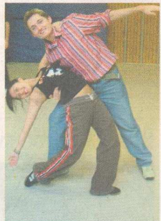
Musical „Chicago“, X-Point-Halle Passau-Kohlbruck.